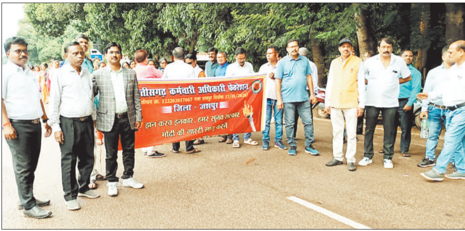
शुक्रवार को हड़ताल में शामिल अधिकारी-कर्मचारी।