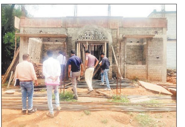
निरीक्षण करते अधिकारी।